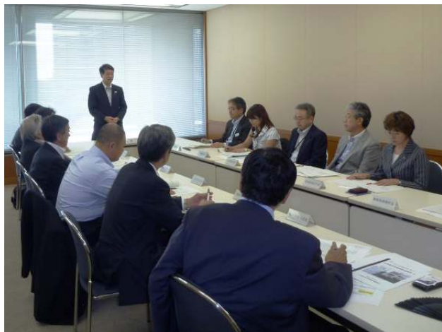
（平成24年度の理事会の様子）

6月18日（月）15:30から、都道府県会館（東京都）にて平成24年度の理事会が開催されました。