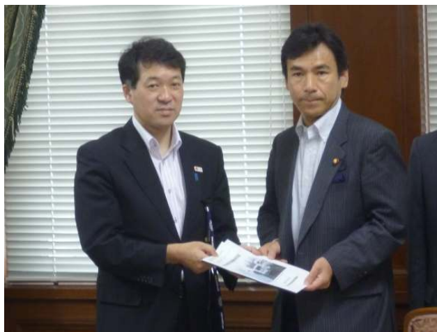
（民主党の阿久津陳情要請対応本部副本部長へ要望書を渡す泉田会長）